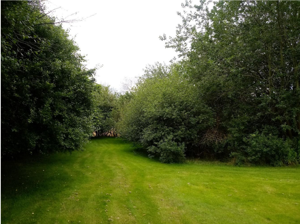
Abb.: Blick auf die Gehölzstrukturen im östlichen Teil des Änderungsbereichs mit der dazwischen liegenden, aufwertungsfähigen Scherrasenfläche (Maßnahme M2)

Damit kann auch weiterhin eine vollständige Kompensation im Geltungsbereich gewährleistet werden.